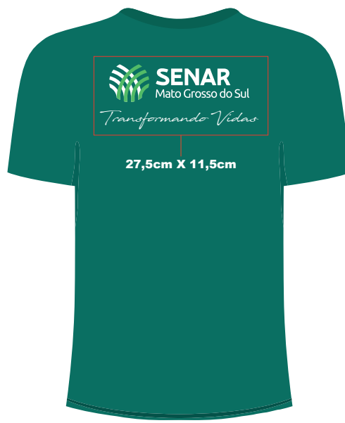
C O S T A