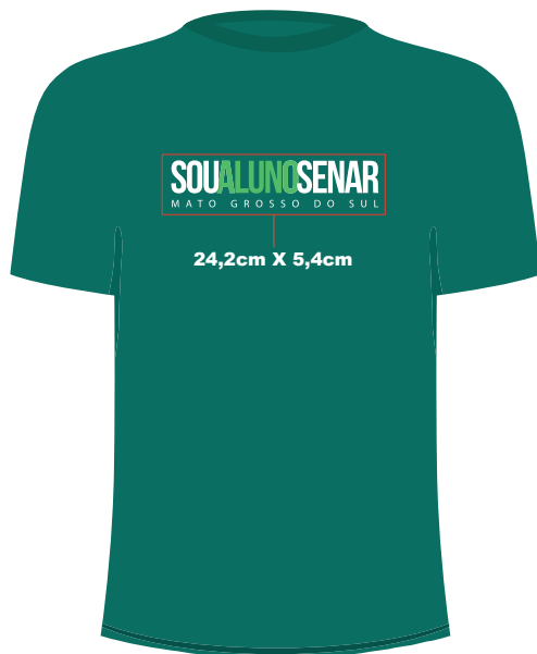
F R E N T E